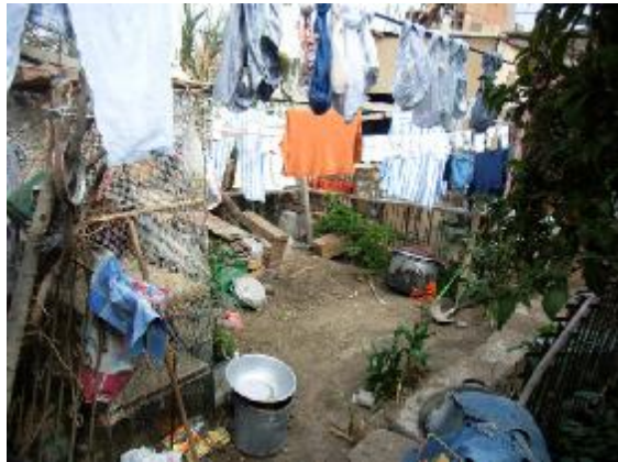
Blick von meinem Zimmer aus, auf den Garten des Hauses

Meine neue Familie ist, so würde ich sagen, peruanischer Mittelstand. Von beiden Eltern geht nur der Papa arbeiten. Weiterhin gibt es zwei Töchter, eine mit 26 und die andere mit 18 Jahren. Die Ältere hat ein Kind, das auch in dem Haus lebt, und arbeitet in einer Bar. Die Jüngere studiert in der nationalen Universität San Augustin Journalismus. Mein Zimmer befindet sich nicht in dem Haupthaus, sondern in einem nachträglich angebauten Gebäude, das mit einem Wellblechdach eingedeckt ist.