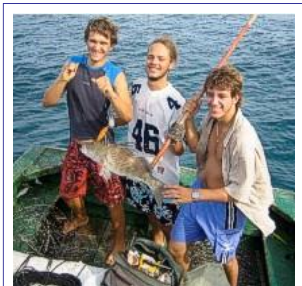
Auf einem Fischerboot an der Küste von Cabo Blanco