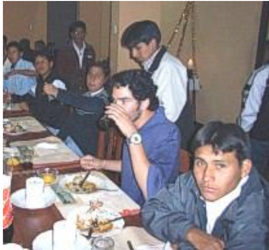
Die Postulanten beim Weihnachtessen

Heilig Abend ging es dann schon etwas harmonischer zu. Von 22 bis 23 Uhr abends gab es eine riesige Messe in der Gemeinde. Anschließend aßen wir im kleinen Kreis mit den Mönchen und den Postulanten Paneton (ein süßes Brot), und dazu tranken wir heiße Schokolade. Pünktlich um Mitternacht wurden die Postulanten dann ins Bett geschickt und die Mönche brachen gemeinsam mit mir auf, um im Zentrum in einem großen Festsaal des historischen zentralen Franziskanerklosters mit anderen Franziskanerpriestern zu speisen. Das Essen wurde sehr edel, von professionellen Kellnern in schwarzen Anzügen, in mehreren Gängen serviert.