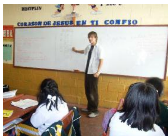
Beim erklären an der Tafel

alleinig eine Klasse zur Ruhe und zum Zuhören zu bringen, was mir am Anfang bei meist über 40 pubertierenden, oft lustlosen Schülern viele Probleme bereitete. Die Unterrichtsstunden die ich selbst machen darf, finden in der Primaria statt. Das heißt die Schüler sind im Alter zwischen 7 und 14 Jahren. Vom Staat Peru werden keine Englischlehrer für die Primaria finanziert, und im vergangenen Jahr hatten meine Schüler und Schülerinnen auch keinen Unterricht in Englisch. Meine Klassen sind also zusätzlich und finden auch ohne Benotung statt.