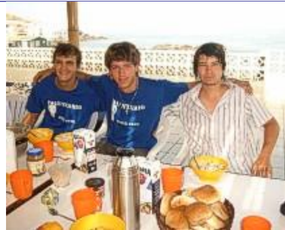
Auf dem Dach des Seminarhauses: Frühstück mit Meerblick

Im Februar fand dann auch das Zwischenseminar mit den 10 anderen Voluntarios in Lima statt. Unsere Unterkunft war ein Haus der deutschen Gemeinde in Lima, welches direkt am Strand steht. Bei sonnigem Wetter, Meeresblick und mit der Gewissheit, dass es in der eigentlichen peruanischen Heimat in strömenden Regnet, viel es leicht, Arequipa für ein paar Tage zu verlassen. Auf dem Zwischenseminar konnten wir unsere Erfahrungen austauschen, neue Kräfte für die zweite Hälfte unseres Peruaufenthaltes sammeln, und sehr viele interessante Themen näher behandeln. So gab es Vorträge über das peruanische Wirtschaftssystem, wir haben über die peruanische Volksfrömmigkeit diskutiert, und auch sehr viel zum Thema interkulturelles Lernen. Das wichtigste für mich war, dass ich wieder auf sehr viele gleichgesinnte gestoßen bin, die in der gleichen Situation wie ich stecken und die selben Probleme und auch Erlebnisse mit mir teilen. Das Zusammentreffen mit ihnen hat mich sehr gestärkt. Es fällt einem um einiges leichter, wenn man weiß, dass man nicht der einzige ist, der in Peru, weit weg von Deutschland, in meiner Situation lebt. Alles in allem war das Semi sehr interessant, und ich war danach mit neuer Lust erfüllt, die zweite Hälfte meines Jahres anzugehen.