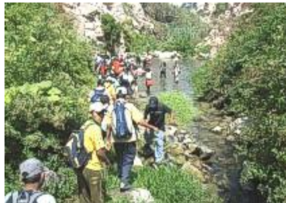
Lagune, die für eine Erfrischung sorgte

Zum Abschluss ging es dann in ein kleines Dorf, welches berühmt für seinen Feigenmost ist. Dieser trägt den Namen Chimbango, und das darum, weil man wenn man zu viel davon dringt nicht nach vorne umfällt, sondern nach hinten. Von den Schülern ist trotz 1, 2 Gläsern (zum Probieren) zum Glück keiner nach hinten umgefallen, aber alle waren total begeistert, und wollen nächsten Sonntag auf jeden fall wieder mit.