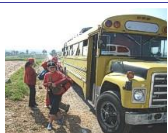
Einer der organisierten Busse

Mein Gastvater, der auch als Lehrer tätig ist, geht schon seit Jahren mit seinen Schülern regelmäßig in Umgebung von Arequipa auf Wanderungen. Arequipa hat wunderschöne Charcras, so nennt man die grünen Gebiete, die außerhalb in der Wüste, meist in Valleys liegen. Das traurige ist, dass es Schüler gibt, die von Arequipa weit aus weniger kennen, als ich. Oft haben die Familien finanziell nicht die Möglichkeiten ihren Kindern das Umfeld zu zeigen, oder wissen gar