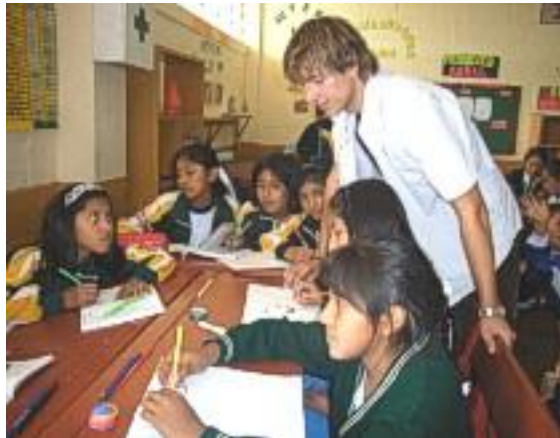
Beim kontrollieren der Hausaufgaben

In meiner Arbeit gab es wegen der Ferien keine großen Veränderungen. Mein Arbeitsfeld wird sich in der Schule „San Pedri y San Pablo“ nun wahrscheinlich eher in Richtung Englischunterricht verschieben, was eine gelungene Abwechslung ist, da ich im letzten halben Jahr fast schon zu viel mit Computern zu tun hatte.