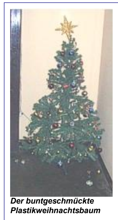
Der buntgeschmückte Plastikweihnachtsbaum

Überall wurden Plastik-Weihnachtsbäume aufgestellt, die in den schrillsten Tönen Weihnachtslieder piepsen konnten. In meinem Kloster allein gab es 4 verschiedene Krippen und natürlich liefen die ganzen Tage über Weihnachtslieder auf den Stereoanlagen. Die Lieder sollte man sich aber nicht wie friedvolle, harmonische deutsche Weihnachtslieder vorstellen, sondern eher wie die von einem Chor von Kleinkindern. Das war so was von KIIIIIIITTTTTSCHIG!!!!