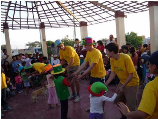
Spiele mit den Kindern