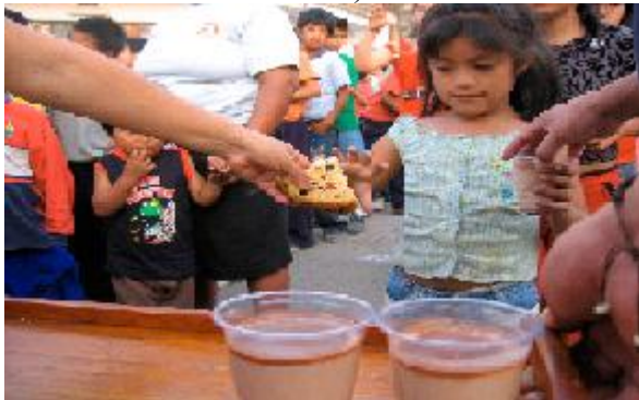
ein kleines Maedl freut sich auf ihr "paneton" und ihre Schoki