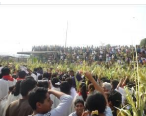
Gottesdienst mit Palmzweigen