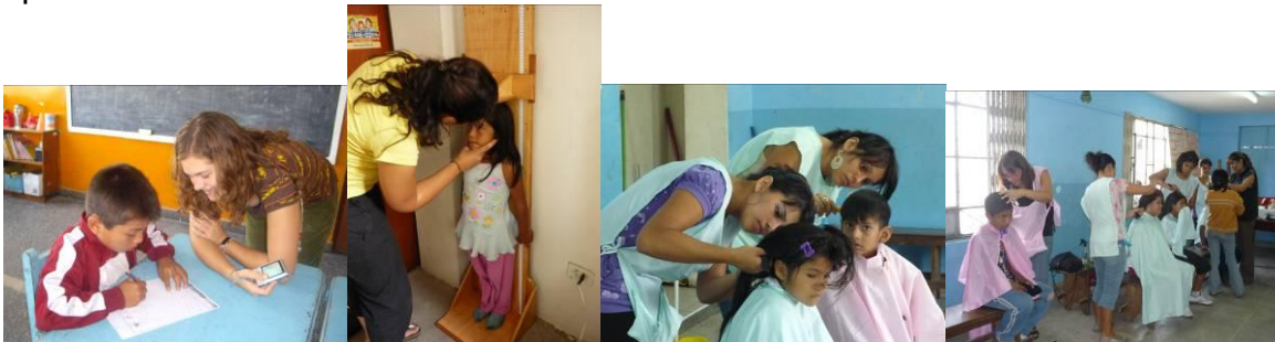
Campaña “talla y peso”