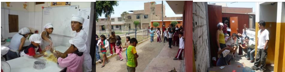
Konditorei der NATS