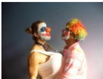
Bei der Animation kam auch die Theatergruppe wieder zum Einsatz, wer erkennt die Hübsche links im Bild? J