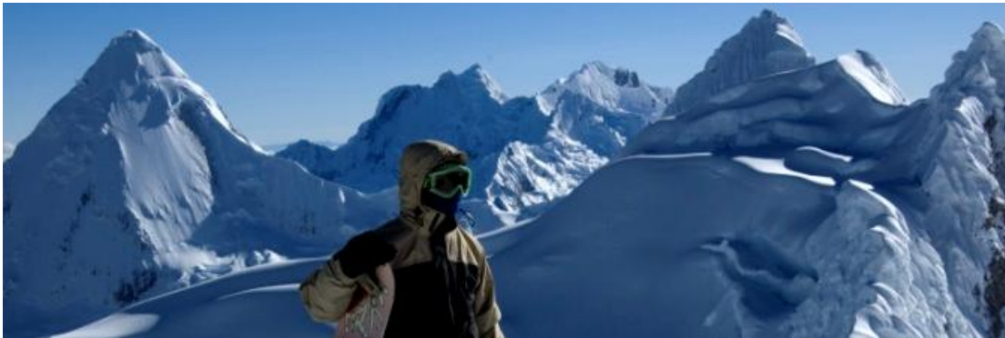
Am Gipfel des „Nevado Pisco“ auf 5762m

Schließlich hab ich mir noch einen Traum verwirklicht, in dem ich mir zwei Tage freigenommen habe und mich nach Huaraz aufgemacht habe. Dort bin ich klettern gegangen, habe in drei Tagen den Gletschergipfel „Pisco“ bestiegen und bin mit dem Snowboard abgefahren. Ich kam an meine körperlichen und geistigen Grenzen wie nie zuvor in meinem Leben, da ich mir keine Zeit zur Akklimatisation nehmen konnte, aber am Ende hat es sich gelohnt.